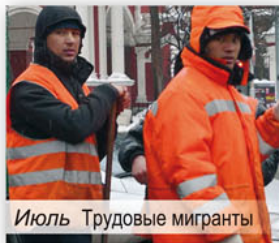
Июль Трудовые мигранты