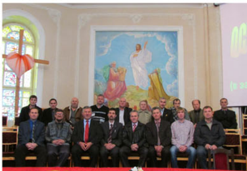
После встречи с пасторами церквей ХМАО, г. Сургут.

Как приятно было осознавать, что наши церкви ещё полны людьми, которые готовы переживать не только о своих близких, но ещё ехать к дальним, чтобы и им указать путь к Богу и в поместную церковь. В Псковской области я встретился с одним братом из Украины, который, несмотря на свои 65 лет, приехал в этот регион в составе команды, чтобы помочь местным верующим в благовестии. До его уверования в Господа большинство окружающих знало его больше по тюремной кличке «Лёнька Пантелеев» и обращалось к нему в основном для помощи в криминальных разборках, так как он имел статус «вора в законе». За свой относительно небольшой тюремный стаж (11 лет) он как-то смог высоко подняться в уголовном мире и даже принять участие в кровавом бунте. Глядя на этого простого жизнерадостного дедушку с бородой и в очках, весело беседующим с сестрами на кухне, я никогда бы не подумал, что этот брат имел такое бурное прошлое. В составе той команды были и сестры, и в качестве мобильной группы из шести человек они смогли за 7 дней провести 82 встречи с неверующими людьми, и стали свидетелями многих покаяний. И я искренно рад, что теперь имею возможность помогать таким людям приезжать в другие церкви и там помогать поддерживать верующих в служении.