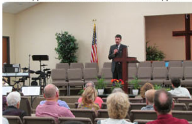
Рассказываю о служении в России в одной из церквей штата Техас.