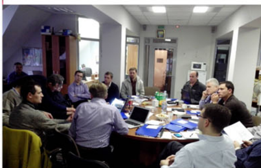
Совещание координаторов миссионерского служения в Москве. В синих папках — описание нашего проекта.

Сейчас, когда год приближается к своему концу, я провожу много времени в поездках, рассказываю о проекте и ищу добровольцев на краткосрочные миссии. Таким образом, сейчас формируется график служений на следующий год, но окончательное слово — за Господом. Готовлюсь посетить Ржев и Кимры (Тверская область), Минск и Черновцы (Украина) в течение ближайших 2-3 недель.