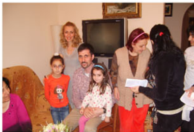
Во время проекта в Армении я стал свидетелем покаяния многих людей.

В августе этого года, после нескольких месяцев молитв и предварительных консультаций я присоединился к служению миссии «Международное Поручение». Эта миссионерская организация начала своё служение 40 лет назад по инициативе одного дьякона баптисткой церкви в штате Техас, и изначально оно было направлено только на благовестие в Мексике. Однако со временем Господь расширил пределы служения, и сейчас оно совершается в 153 странах мира. Но в эту миссию я вступил не из-за масштабов её служения, а из-за ориентированности её служения на поместные церкви. Думаю, что именно этого нам часто не хватало, когда шла речь о сотрудничестве наших церквей с зарубежными миссиями. Кроме того, я считаю, что организация подобных проектов межцерковного благовестия является лучшей формой для осуществления краткосрочных миссий в нашей стране.