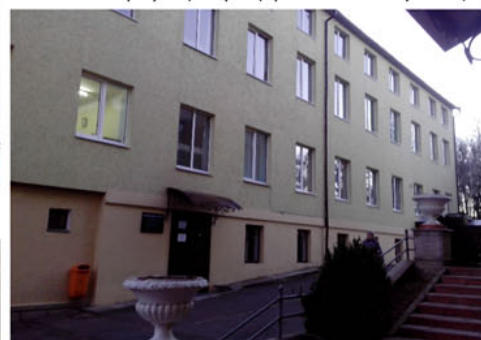
Учебный корпус Центр. Церкви ЕХБ г.Черновцы

Вверху: Оформление колодца при церкви в г. Черновцы (типичное для всей местности)